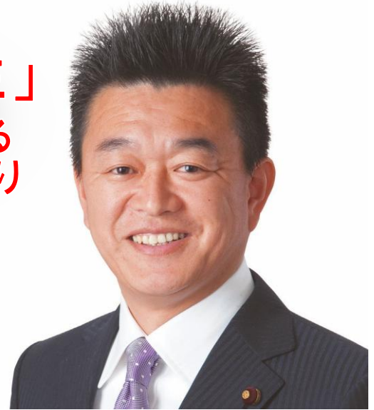
横浜市議員〔戸塚区〕