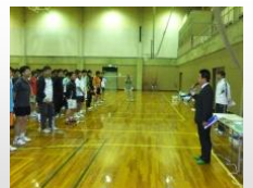
(神奈川県実業団バドミントン大会において)

横浜市議会では、健康づくり・スポーツ推進特別委員会の副委員長を務め、「健康寿命日本一」をめざす横浜市の取り組みを推進しています。また、神奈川県実業団バドミントン連盟会長・神奈川県小学生野球連盟副会長の役職を務め、スポーツ振興にも寄与しています。